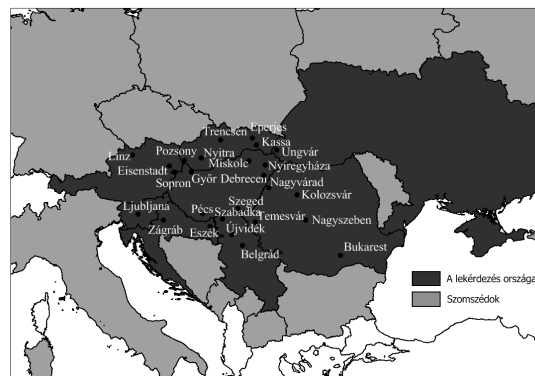
A lekérdezés országai

A munka elsősorban a politikai földrajz és a regionális tudomány területén mozgott, felhasználva a közigazgatási és a választási földrajz, valamint a mentális térképezés