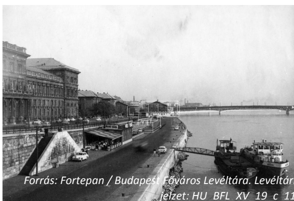
1967, Marx Károly Közgazdaságtudományi Egyetem

Sok világhírű vendég is érkezett ide azokban az években. Roy Radner , a csapatelmélet (theory of teams) egyik atyja 1970 körül járt itt. Tjalling Koopmans , aki később Nobel-díjat kapott, növekedésméletről beszélt a Kossuth Klubban. Káldor Miklós a hetvenes években tartott előadást a nyersanyagárak nemzetközi stabilizálásáról. Joan Robinsont , a világhírű közgazdászt nemcsak hivatalosan, de még egyikük lakásán is fogadták 1981-ben. Ők és még sokan mások szabadon jöhettek, és szabadon beszélhettek az akadémián. A tudósok maguk is érdeklődéssel tekintettek Magyarországra, mint nem totalitárius, nem túl szigorúan ellenőrzött, mégis tekintélyelvű kommunista államra.